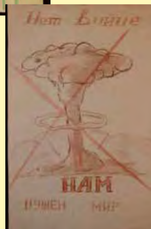
Родион Филатов, 10 лет