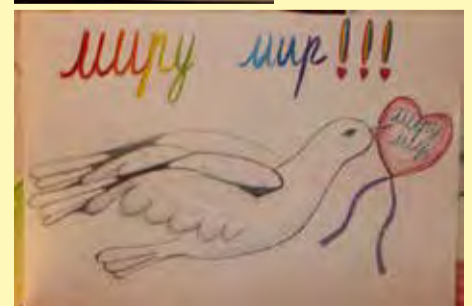
Катя Бысенко, 10 лет