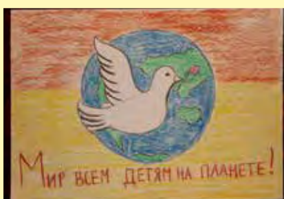
Настя Челочева, 10 лет