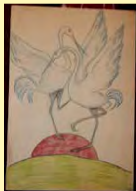
Валентин Великуров, 9 лет