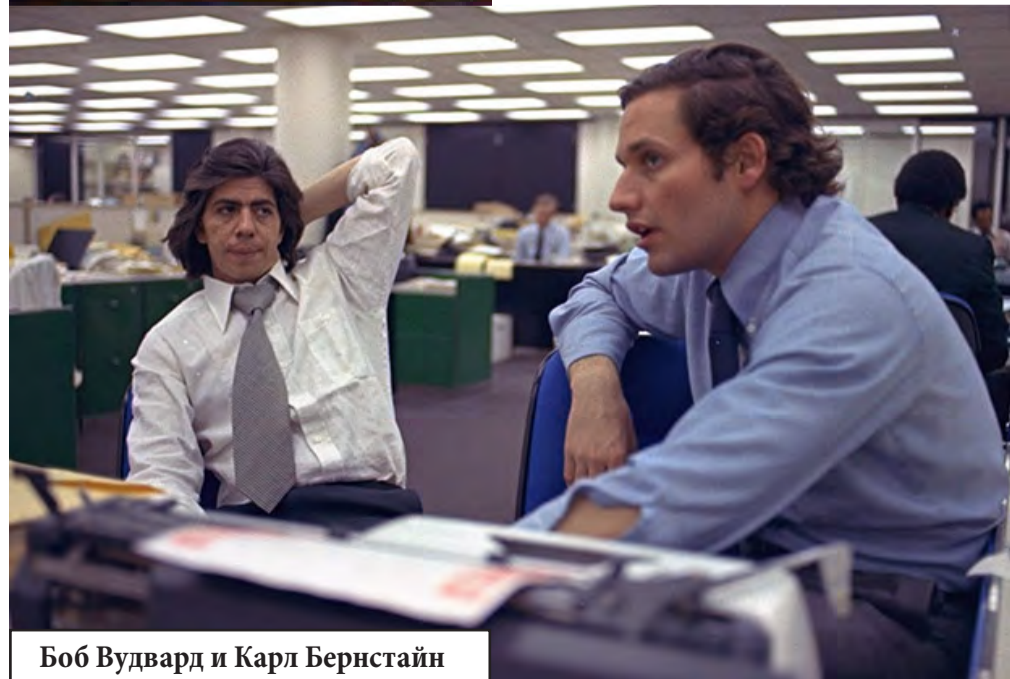
Боб Вудвард и Карл Бернштейн